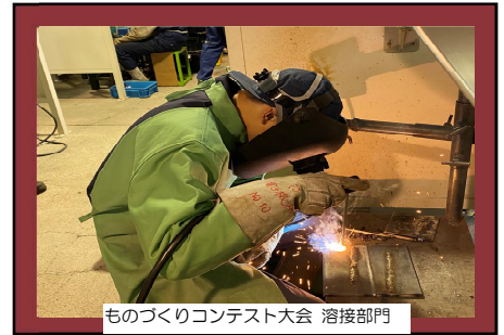
ものづくりコンテスト大会 溶接部門