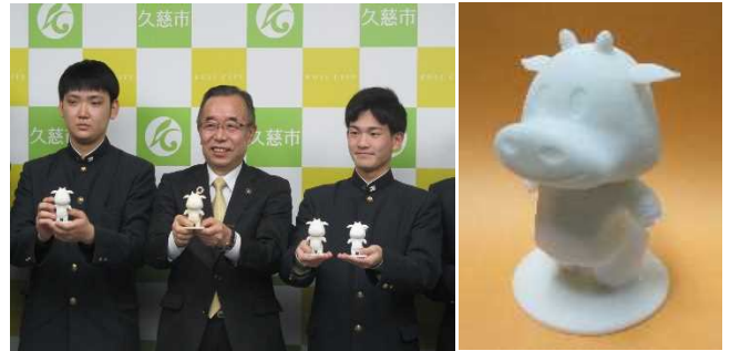
3次元化した「タン君」